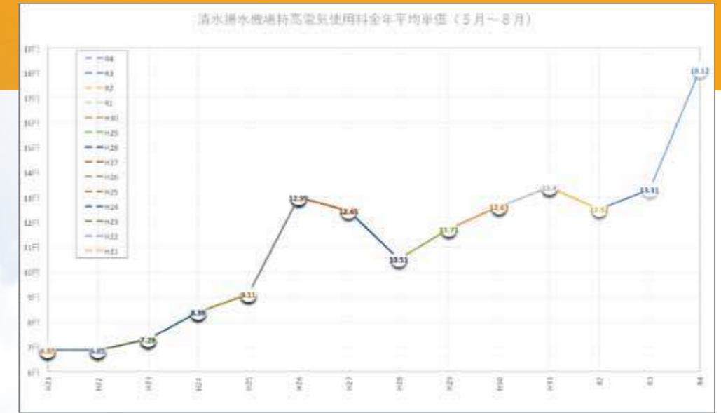
H26～R4電気料単価折れ線グラフ 月別電気料金単価(H26-R4)

二点目は「農林水産省による農業水利施設の省エネルギー化推進対策(令和4年度補正予算)」です。基水利施設管理事業、水利施設管理強化事業の対象施設で省エネ推進対策の実施要件を満たした施設が対象となり、農水省の計算式による令和4年度のエネルギー価格高騰分の70%が補助されます。