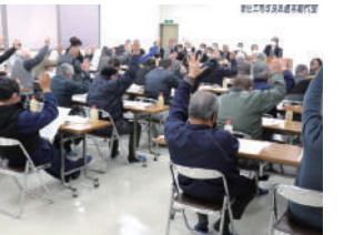
第44回通常総代会採決状況