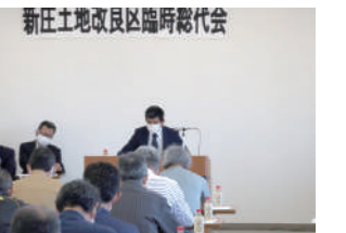
令和3年度臨時総代会開催状況