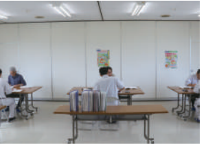
決算監査執行状況