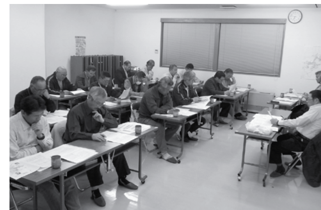
第1回理事会の状況