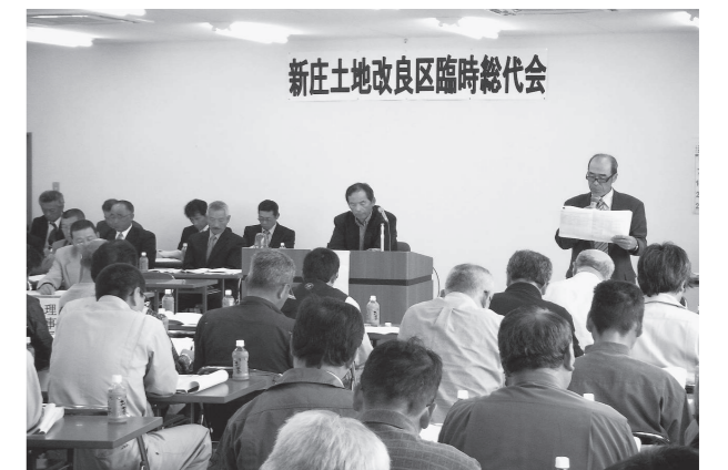
臨時総代会監査報告