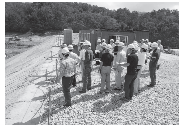
役員研修（堤沢ため池工事）