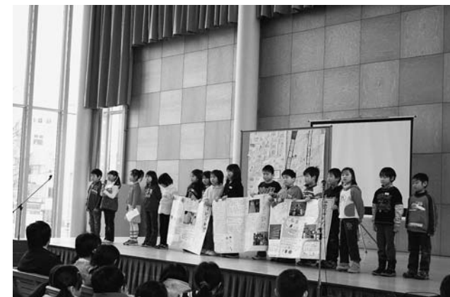
③北辰小学校の発表 「守ろう ふやそう イバラトミヨ」 「こだわりの北辰米」等