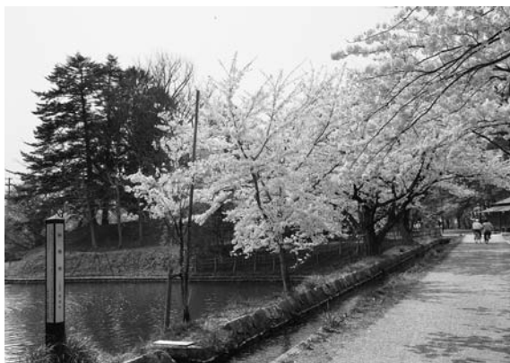
満開の桜の下の御用水堰

執筆活動を進める中で、改良区設立以前に活用していた各地域の井堰（松本堰、宮田堰、御用水堰等）、ため池等の資料が不足し支障をきたしております。古文書や関係資料等にお心あたりがございましたら、是非ご一報いただきたくお願い申し上げます。