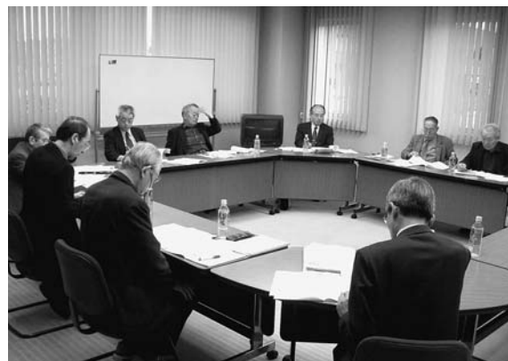
区史執筆委員会の様子