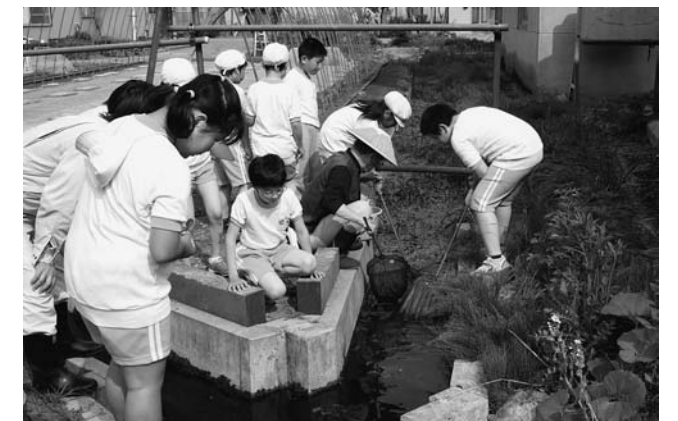
④イバラトミヨ塾 「イバラトミヨの保護活動」

また、昨年度から実施された沼田小学校の『ときわの森プロジェクト』の一員として参加し、水車やビオトープづくりをサポートしております。水車を回す水は、茶鍛冶堰や新庄用水の残水であります。