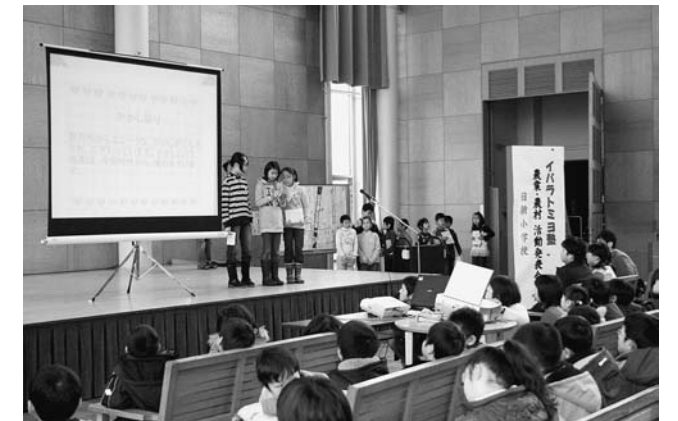
②日新小学校の発表 米づくりを通して見つめよう わたしたちの生活