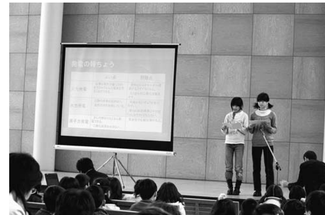
①山屋小学校の発表 「くらしとエネルギー」 〈減らそうCO2〉

今年度も引き続き、北辰小学校の児童と一緒に『イバラトミヨ塾』を開催し、保護活動等を実践してまいりました。1月10日(土)には、その成果を発表する場である『イバラトミヨ塾2009in ゆめりあ』を開催されました。今年、北辰小学校だけでなく、山屋小学校や日新小学校の児童も参加し、エネルギーや環境そしてコメ作りについての発表が行われました。