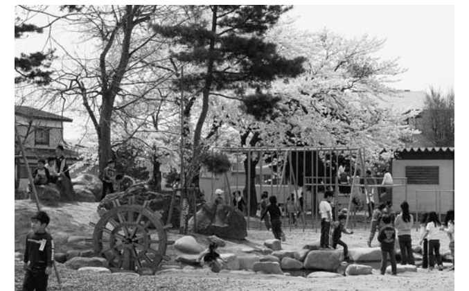
ビオトープで遊ぶ沼田小学校児童

その他の地域や学校でもなにかございましたら、お気軽にご相談していただければと思います。