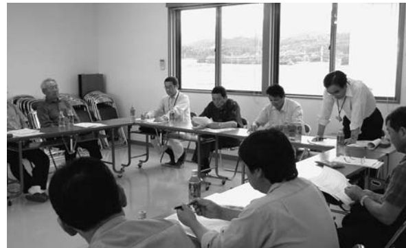
合併推進協議会の様子

1月6日 第2回新庄地区土地改良区合併推進協議会開催 協議内容 統合整備計画書の検討 管理再編整備計画策定に向けた検討