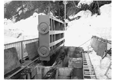
(清水揚水機吸水槽ゲート補修)

◇事業内容：清水揚水機場の吸水槽制水ゲート及び建屋補修、小月野揚水機場電気設備補修、1号幹線用水路パイプライン目地補修33箇所、7-2分土工ゲート補修、流量計・水位計各4箇所の更新整備を実施した。