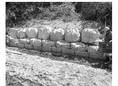
(山屋地区災害復旧工事)

◇事業内容：対象施設の点検整備を実施し、電力料及び施設管理人件費、各地区維持管理交付金等を支出した。