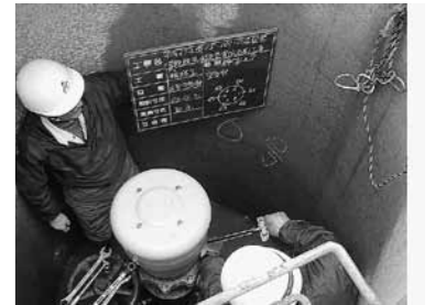
(6号空気弁災害復旧工事)

◇事業内容：1号幹線用水路の空気弁復旧2箇所、パイプライン目地補修24箇所を実施した。