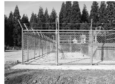
(小月野吐水槽周辺舗装)

山形県より施設管理の一部を受託（受託料9,589千円）し、各施設の点検整備を実施し、電力料及び施設管理人件費を支出した。