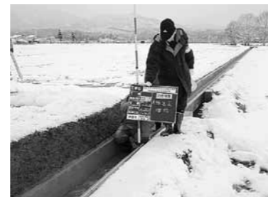
(向田用水路布設替)