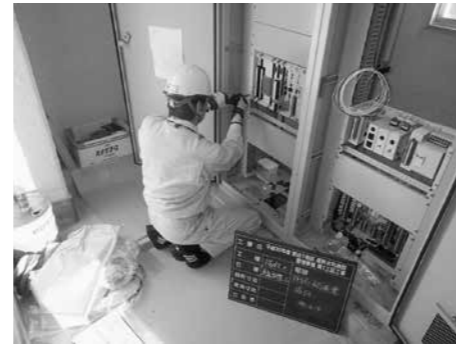
調整工電源基盤交換