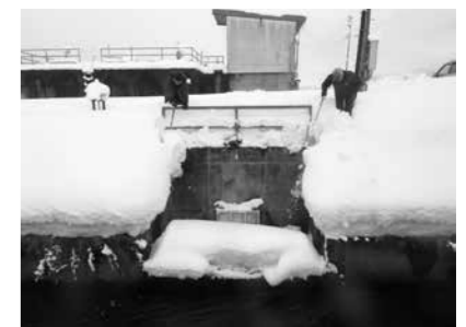
消流雪用水通水作業