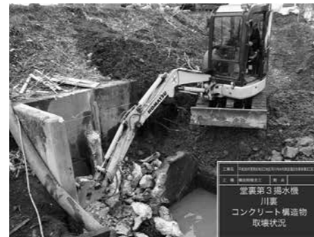
旧堰撤去（堂裏第3揚水機）