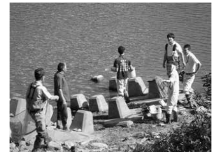
小泉ため池生き物調査