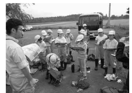
秋のイバラトミヨ塾