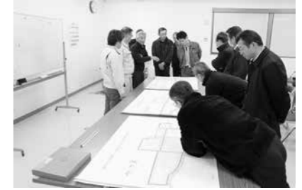
高壇地区事業説明会